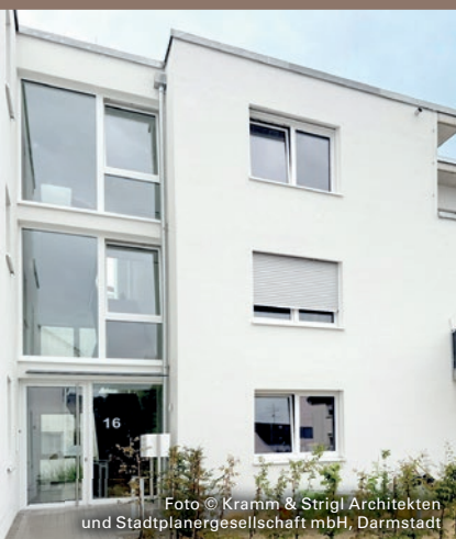
Foto © Kramm & Strigl Architekten und Stadtplanergesellschaft mbH, Darmstadt

Der Baukörper wird durch eine Fuge in zwei versetzt zueinanderstehende Volumen gegliedert. Diese Anordnung ermöglicht eine optimale Belichtung der Wohnungen, schafft angemessene Abstände zur Nachbarbebauung und nimmt Rücksicht auf die bestehende Struktur. Die Fuge fungiert als zentrales, natürlich belichtetes Treppenhaus und erschließt die acht Wohneinheiten über zwei Vollgeschosse und ein Staffelgeschoss – barrierefrei per Treppe und Aufzug.