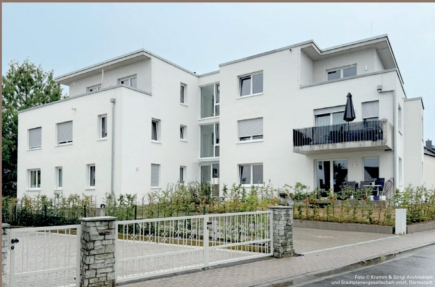
Foto © Kramm & Strigl Architekten und Stadtplanergesellschaft mbH, Darmstadt